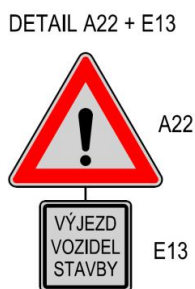
Obr. 1: Detail navrženého SDZ

Na vjezdu na parkoviště na parcele č. 5717 bude umístěna značka A22 – Jiné nebezpečí s dodatkovou tabulkou E13 – „Výjezd vozidel stavby“, tj. ve vzdálenosti cca 30 m od trvalého sjezdu, ze kterého bude sjížděno do koryta Dyje. Stejná značka s dodatkovou tabulkou bude umístěna na chodníku na pravém břehu ve vzdálenosti cca 60 m od trvalého sjezdu do koryta.